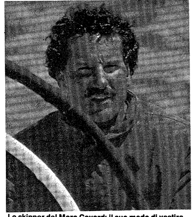
Lo skipper del Moro Cayard: il suo modo di vestire diventerà moda.

Si, è deciso, quest'estate vestiremo alla marinara: a decretarlo non sono stati, una volta tanto, gli stilisti ma i satelliti che inonda le notti italiane con le immagini gloriose dell'impresa del Moro di Venezia. Bermuda, magliette e giubbotti antivento saranno protagonisti dell'abbigliamento estivo di velisti veri o presunti, di pigroni, giovanissimi e commendatori. E se Revlon, colosso della cosmesi internazionale, ha sborsato in questi giorni dodici miliardi per assicurarsi la bellezza stile B.B. di Claudia Schiffer come testimonial dei suoi prodotti, quanto dovrebbero dare quelli della Murphy & Nye (velai genovesi, nonostante il nome) a Paul Cayard per come indossa, sfidando la brezza della baia di San Diego, il loro gilet color verde salvia? È un capo, quello, che rischia di diventare mitico: una sorta di Timberland degli Anni 90. Sarà anche — come dice la scheda tecnica — una microfibrina ad alto potere isolante termico. Visto addosso al bel Paul che con felina determinazione manovra il suo Moro, fa l'effetto di una corazzata. Uno scudo magico, qualcosa che, alle fantasie più accese, fa venire in mente i cavalieri della Tavola Rotonda: coraggio e inflessibili contro le ingiustizie (leggi bompresso). Se è così forte la carica simbolica che, anche grazie al video, un semplice glielie ha assunto, chi saprà rinfiutare quest'estate a qualcosa che