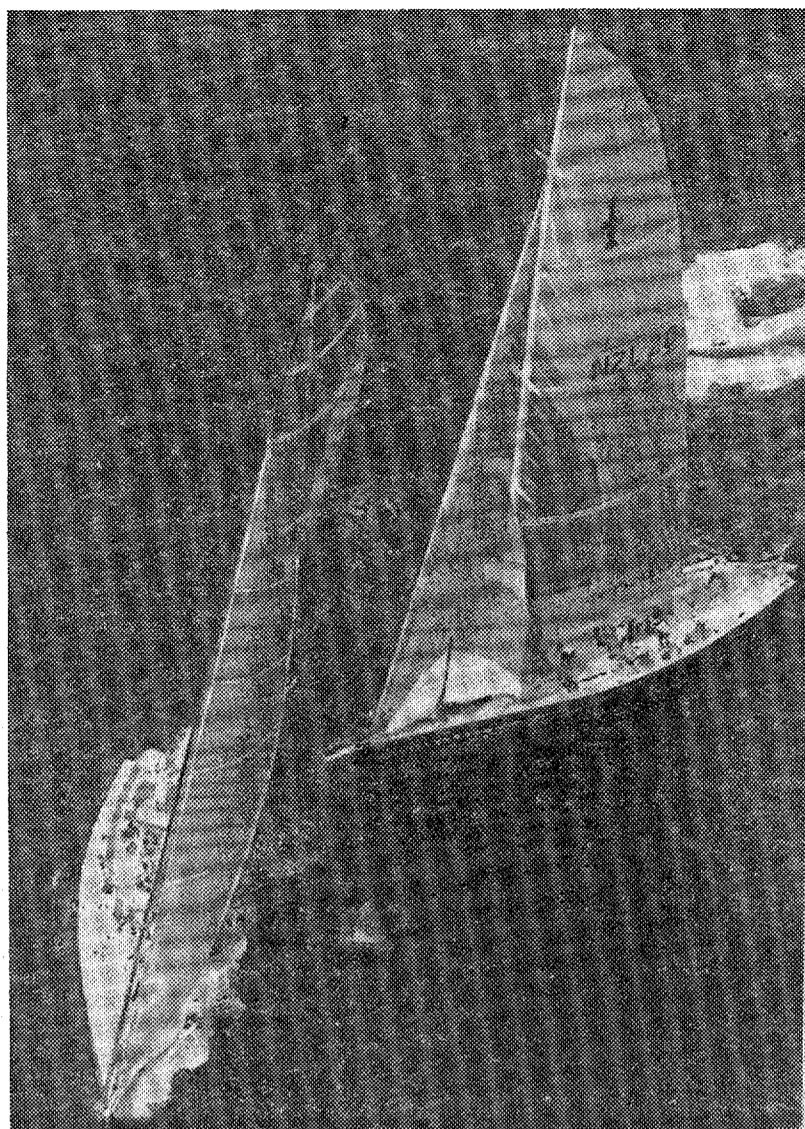
Il Moro di Venezia (a sinistra) e New Zealand in regata. A destra, il campo di regata

New Zealand si arrende per l'ultima volta: finisce 5-3 per la barca italiana. Comincia così la sfida più importante