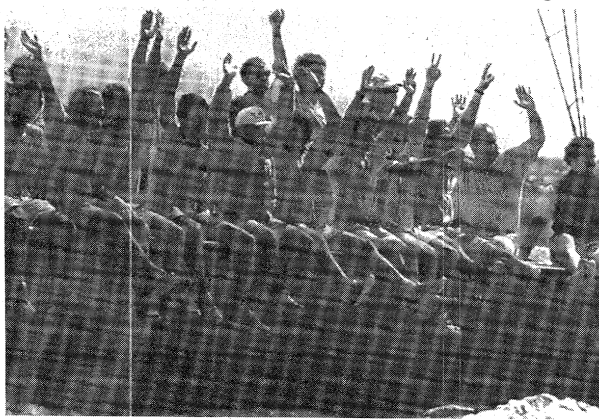
L'equipaggio del Moro festeggia la vittoria nella Vuitton Cup su New Zealand: dal 9 maggio sfiderà America 3

Dopo la vittoria sulla barca appoggio è stata issata accanto alla bandiera blu con le stelle della Comunità europea un enorme tricolore, ma poche ore dopo Gardini ha ribadito la sua intenzione